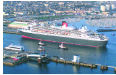
Cherbourg : Port d'escales du Queen Mary 2