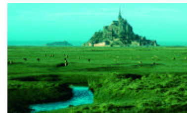
Le Mont-Saint-Michel : Un patrimoine mondial de l'Unesco en Normandie