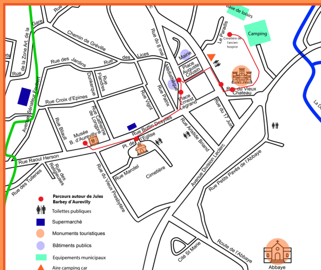
Plan de Saint-Sauveur-le-Vicomte

Moins de 18 ans / Groupe scolaire ou étudiant / Spot50 Pass accueil Normandie / Membre de l'Association des Amis du musée / Personnel du Ministère de la Culture Personnel des Offices de Tourisme / Membre de l'ICOM Personne en situation de handicap